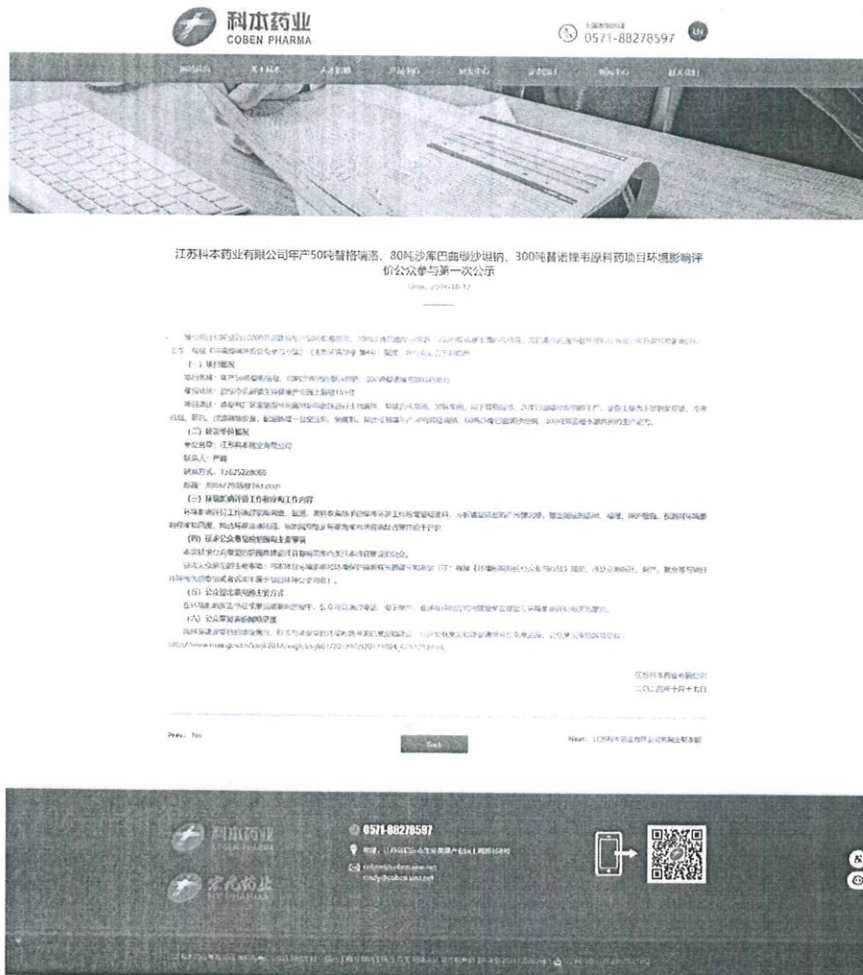
图 2.2-1 首次环境影响评价信息公开截图

首次环境影响评价信息采用网络公示，本项目首次环境影响评价信息公开的时间：2024年10月17日，公示期为10个工作日，网址为 http://www.cobenpharm.com/ 。