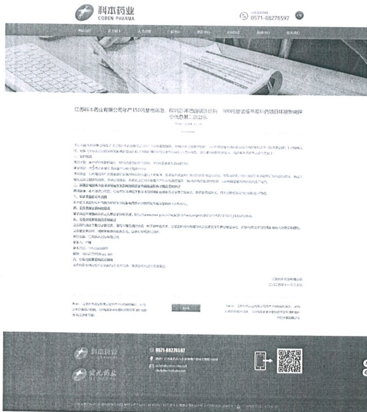
图 3.2-1 征求意见稿网络截图

公示网站为公司网站。网络公示时间为 2024 年 11 月 20 日-11 月 30 日，公示网址： http://www.cobenpharm.com/ 。网页截图见图 3.2-1。